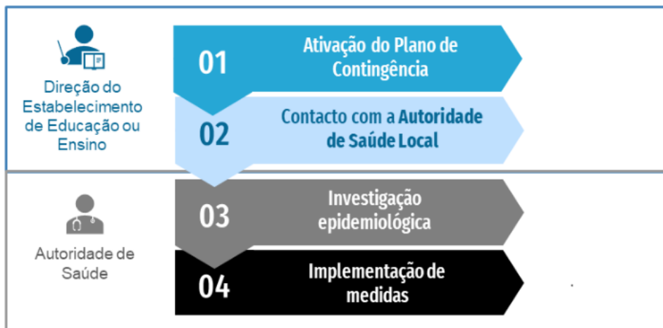
• Figura 2. Fluxograma de atuação perante um caso confirmado de COVID-19 em contexto escolar